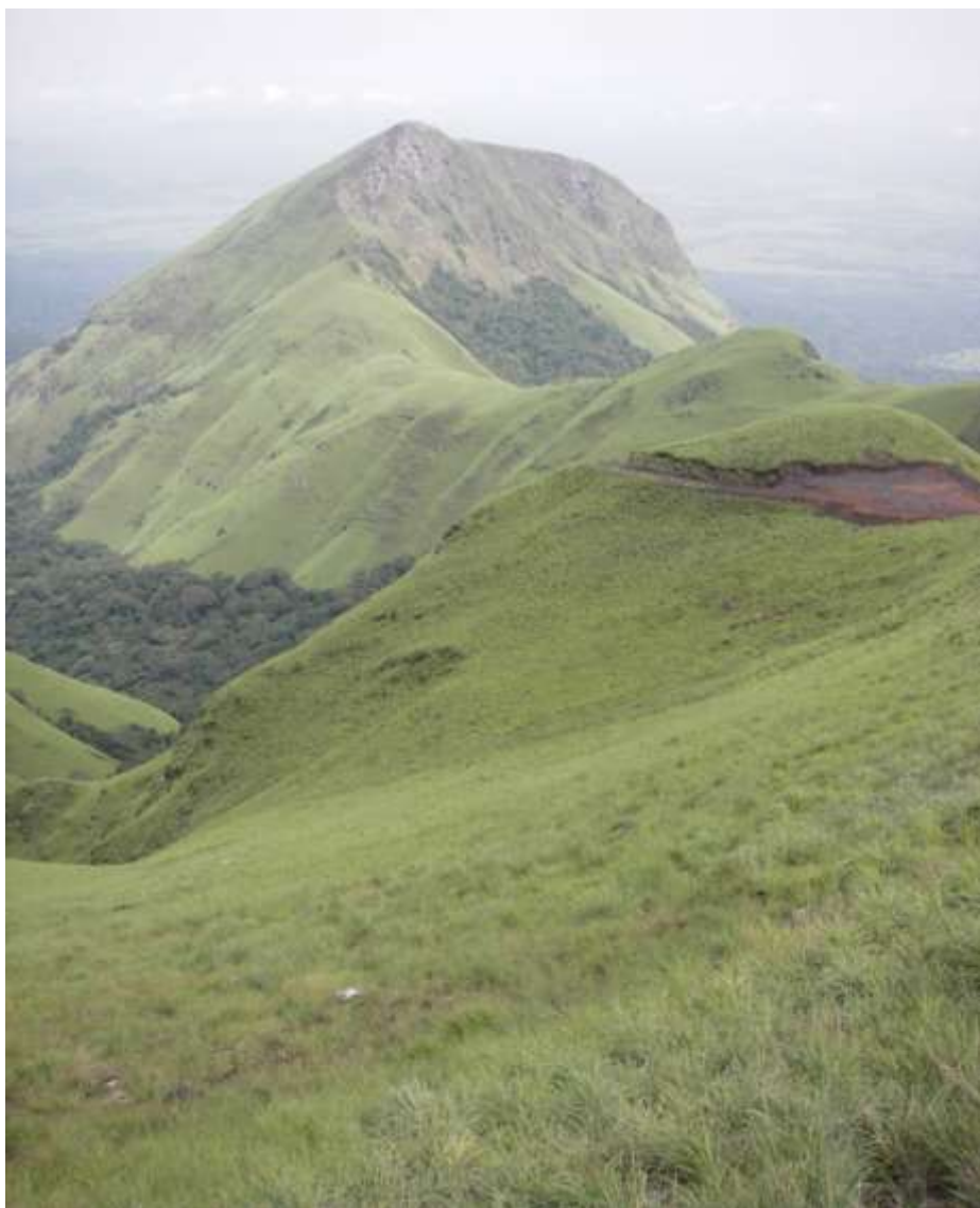
Photo 7 : Début des activités minières au Nimba guinéen

Autre photos intéressantes des Monts Nimba :