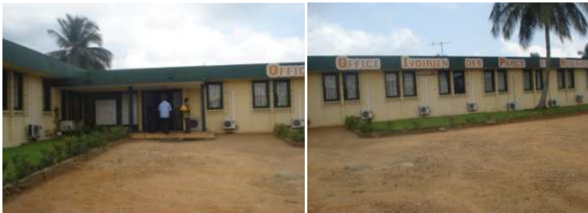
Photos 5-6 : Vue extérieure des bureaux de l'OIPR à Abidjan en Côte d'Ivoire

Mais il est important de signaler ici que l'OIPR possède assez d'installation dans la capitale qui comprend une base vie avec des bureau bien équipé et conecté à l'Internet haut débit.