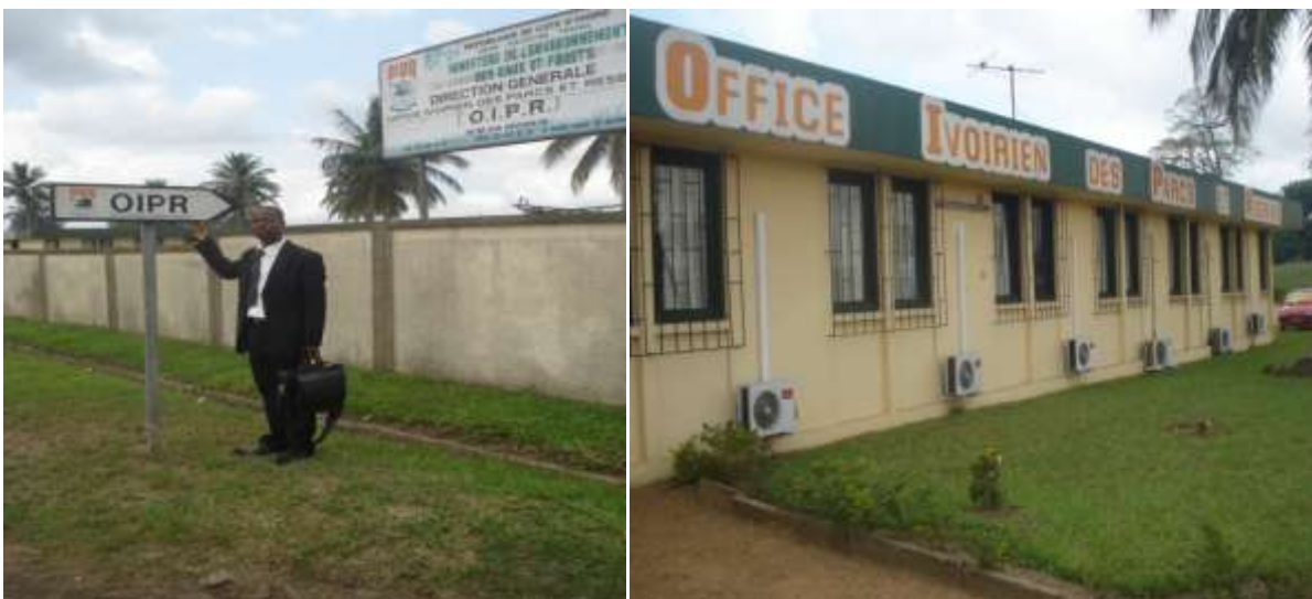
Photo 3-4 : Entrée des bureaux de l'OIPR à Abidjan (Côte d'Ivoire)

Mais l'un des problème auxquels nous nous trouverons souvent confrontés est le fait que la forêt de Déré-Tiapleu est considérée comme une des aires centrales donc partie intégrante de la Réserve de Biosphère des Monts Nimba en Guinée alors que cette même forêt possède jusqu'ici le statut de simple forêt classée en côte d'Ivoire. Dès lors sa gestion ne relève pas l'OIPR (Réf. Photo 3-4) mais plutôt de la SODEFOR, qui peut délivrer des permit de coupe de bois pour l'exploitation forestière à Déré-Tiapleu. A cet effet, nous devrions associer la SODEFOR aux discussions lorsqu'il s'agit de la forêt de Déré.