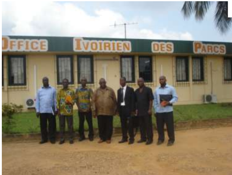
Photo1 : Photo de Famille avec le personnel de l'OIPR – Côte d'Ivoire