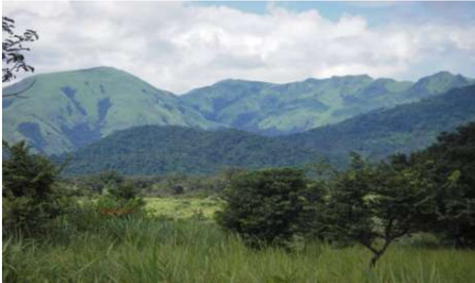
Photo2 : Vue des Monts Nimba, coté guinéen